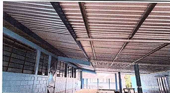
Foto 2: Finalización e instalación de estructura de techo y cubierta de lámina.