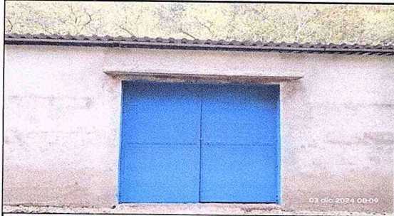
Foto1: Porton instalado en el centro educativo finalizado.